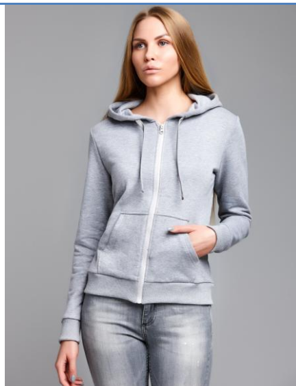
13 Толстовка WM Basic Gray

Толстовка приталенного кроя с капюшоном. Хорошо сидит, приятная к телу. Высокая доля хлопка обеспечивает повышенную износостойкость материала. Российский размер, не маломерка.