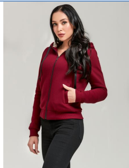
14 Толстовка WM Super Hoodie Bordo

СУПЕР ТЕПЛАЯ И УЮТНАЯ трикотажная куртка! Согреть тебя даже в самую холодную погоду! Сделана из высококачественного футера, внутренняя отделка из искусственного меха. Высокая доля хлопка обеспечивает повышенную износостойкость материала.