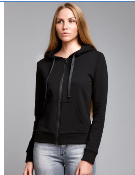
12 Толстовка WM Basic Black

Толстовка приталенного кроя с капюшоном. Хорошо сидит, приятная к телу. Высокая доля хлопка обеспечивает повышенную износостойкость материала. Российский размер, не маломерка.