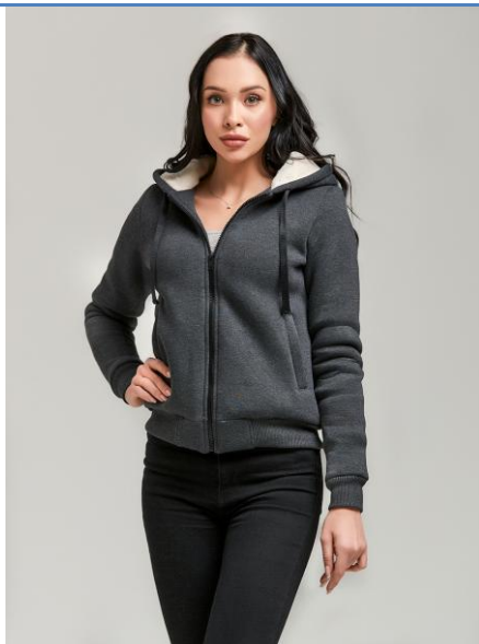
15 Толстовка WM Super Hoodie Antracit

СУПЕР ТЕПЛАЯ И УЮТНАЯ трикотажная куртка! Согреет тебя даже в самую холодную погоду! Сделана из высококачественного футера, внутренняя отделка из искусственного меха. Высокая доля хлопка обеспечивает повышенную износостойкость материала.