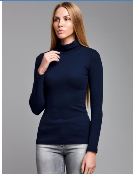
11 Водолазка Women Dark Blue

Женская водолазка, посадка Super Slim Fit. Ткань содержит лайкру , за счет этого тянется и облегает фигуру. Материал отличается повышенной износостойкостью, водолазка не теряет форму после многократных стирок.