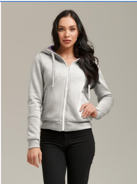
16 Толстовка Super Hoodie Melange

СУПЕР ТЕПЛАЯ И УЮТНАЯ трикотажная куртка! Согреет тебя даже в самую холодную погоду! Сделана из высококачественного футера, внутренняя отделка из искусственного меха. Высокая доля хлопка обеспечивает повышенную износостойкость материала.