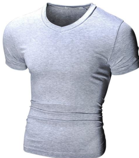
24 Футболка Basic Gray

Футболка с V-образным вырезом. Посадка Super Slim Fit. Ткань содержит лайкру , за счет этого тянется и облегает фигуру. Материал отличается повышенной износостойкостью, футболка не теряет форму после многократных стирок.