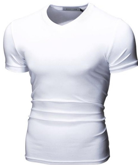
23 Футболка Basic White

Футболка с V-образным вырезом. Посадка Super Slim Fit. Ткань содержит лайкру , за счет этого тянется и облегает фигуру. Материал отличается повышенной износостойкостью, футболка не теряет форму после многократных стирок.