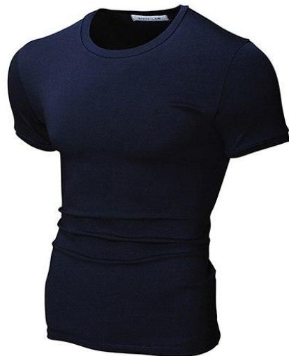
22 Футболка Round Dark Blue

Футболка с круглым вырезом, посадка Super Slim Fit. Ткань содержит лайкру , за счет этого тянется и облегает фигуру. Материал отличается повышенной износостойкостью, футболка не теряет форму после многократных стирок.