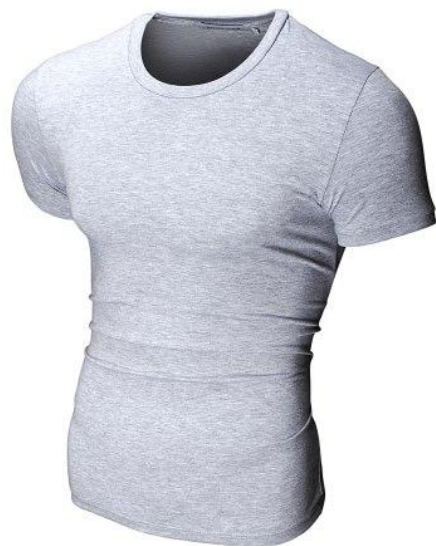
21 Футболка Round Gray

Футболка с круглым вырезом, посадка Super Slim Fit. Ткань содержит лайкру , за счет этого тянется и облегает фигуру. Материал отличается повышенной износостойкостью, футболка не теряет форму после многократных стирок.