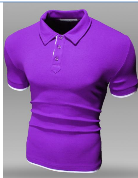
28 Поло Strict Violet

Поло приталенного кроя. Ткань содержит лайкру , за счет этого тянется и облегает фигуру. Высокая доля хлопка обеспечивает повышенную износостойкость материала.