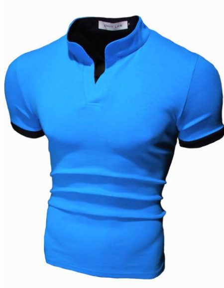
27 Поло Aqua Blue

Поло приталенного кроя. Ткань содержит лайкру , за счет этого тянется и облегает фигуру. Высокая доля хлопка обеспечивает повышенную износостойкость материала.