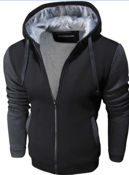
18 Толстовка Super Hoodie Antracit

СУПЕР ТЕПЛАЯ И УЮТНАЯ трикотажная куртка! Сделана из высококачественного футера, внутренняя отделка из искусственного меха. Высокая доля хлопка обеспечивает повышенную износостойкость материала. Российский размер, не маломерка.