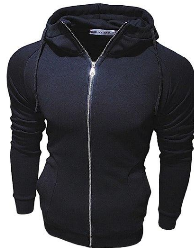
22 Толстовка Kash Hoodie

Толстовка приталенного кроя с капюшоном. Хорошо сидит, приятная к телу. Высокая доля хлопка обеспечивает повышенную износостойкость материала. Российский размер, не маломерка.