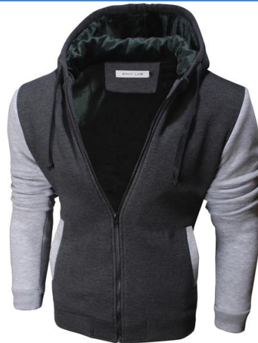
16 Толстовка Super Hoodie Antracit Melange

СУПЕР ТЕПЛАЯ И УЮТНАЯ трикотажная куртка! Сделана из высококачественного футера, внутренняя отделка из искусственного меха. Высокая доля хлопка обеспечивает повышенную износостойкость материала. Российский размер, не маломерка.