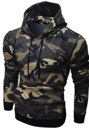
21 Толстовка Basic Hoodie Military

Легкая толстовка приталенного кроя с капюшоном. Хорошо сидит, приятная к телу. Ткань содержит лайкру, за счет этого тянется, но не теряет форму после стирки. Российский размер, не маломерка.