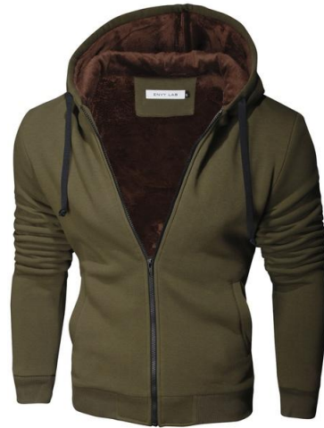
15 Толстовка Super Hoodie Dark Green

СУПЕР ТЕПЛАЯ И УЮТНАЯ трикотажная куртка! Сделана из высококачественного футера, внутренняя отделка из искусственного меха. Высокая доля хлопка обеспечивает повышенную износостойкость материала. Российский размер, не маломерка.