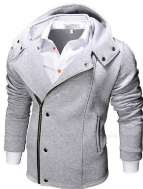
12 Толстовка R- Line Hoodie Gray

Теплая толстовка с капюшоном. Сделана из высококачественного футера с начесом. Весной отлично подойдет в качестве верхней одежды. Приталенный крой, сидит плотно по фигуре.