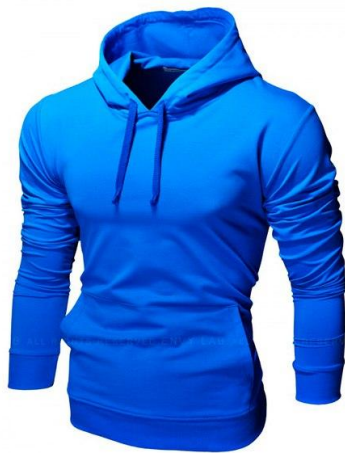
25 Толстовка Basic Hoodie Blue

Легкая толстовка приталенного кроя с капюшоном. Хорошо сидит, приятная к телу. Ткань содержит лайкру, за счет этого тянется, но не теряет форму после стирки. Российский размер, не маломерка.