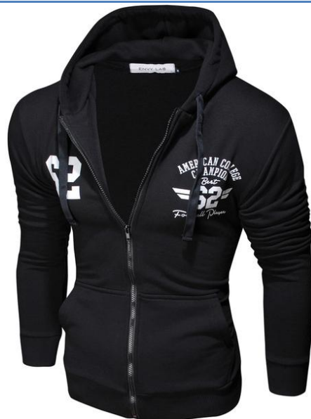
6 Толстовка College Champion Black

Толстовка приталенного кроя с капюшоном. Хорошо сидит, приятная к телу. Высокая доля хлопка обеспечивает повышенную износостойкость материала. Супер устойчивый принт на груди. Устойчив к стирке и сохраняет первозданный вид в течение всего срока эксплуатации.