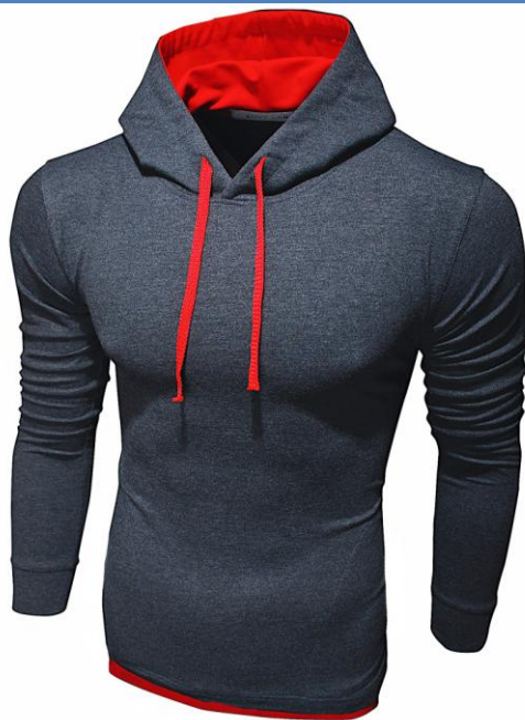
11 Толстовка Hoodie Antracit Red

Легкая толстовка приталенного кроя с капюшоном. Хорошо сидит, приятная к телу. Ткань содержит лайкру, за счет этого тянется, но не теряет форму после стирки. Российский размер, не маломерка.