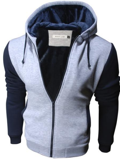
17 Толстовка Super Hoodie Melange Dark Blue

СУПЕР ТЕПЛАЯ И УЮТНАЯ трикотажная куртка! Сделана из высококачественного футера, внутренняя отделка из искусственного меха. Высокая доля хлопка обеспечивает повышенную износостойкость материала. Российский размер, не маломерка.