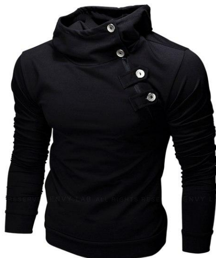
26 Легкое худи Neck Zip Hoodie Black

Легкая толстовка приталенного кроя с капюшоном. Необычный внешний вид. Хорошо сидит, приятная к телу. Ткань содержит лайкру, за счет этого тянется, но не теряет форму после стирки. Российский размер, не маломерка.