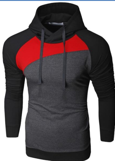
5 Толстовка Red Diagonale

Легкая толстовка приталенного кроя с капюшоном. Хорошо сидит, приятная к телу. Ткань содержит лайкру, за счет этого тянется, но не теряет форму после стирки. Российский размер, не маломерка.